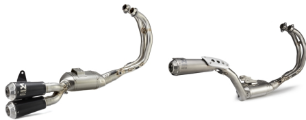
Plnohodnotný výfukový systém s titanovým tlumičem výfuku